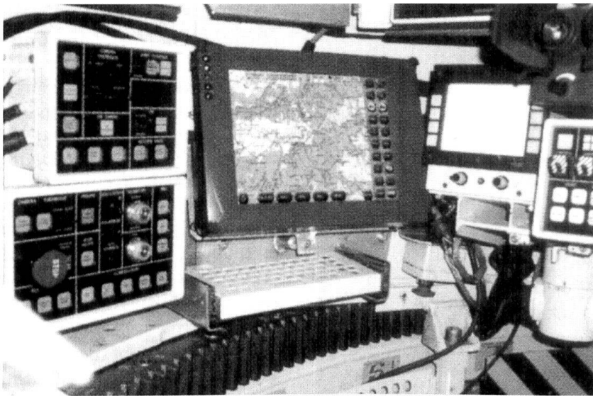
Le BMS Finders de GIAT Industries.

■ Thales, maître d'œuvre du SIC.F destiné aux grandes unités, propose son propre SIT à l'exportation, qui n'a pas été retenu en France. Son architecture simple permet aux véhicules du rang de recevoir calques et ordres de mission. Il est possible d'envoyer quelques annonces vers le haut mais, d'une façon générale, le système a des performances très limitées.