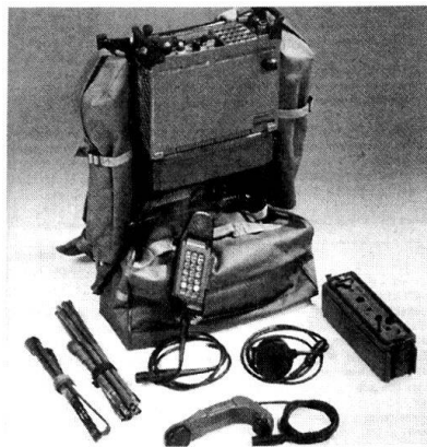
Le PR4G/SE-235 de Thales, en service en Suisse.

Le système américain, avec des adaptations mineures, a été adopté par l'Angleterre, le Canada, la Hollande, l'Allemagne et Israël. Il avantage les unités débarquées, qui disposent d'émetteurs-récepteurs de taille et d'encombrement réduits. Les bas échelons peuvent émettre quantité d'informations, mais reçoivent peu de renseignements en échange. On a donc choisi d'avantager le Situational Awareness (SA) , du bas vers le haut, au Command & Control (C 2 ) , qui va du haut vers le bas. Ce système très centralisé est évidemment vulnérable si les «nodes» WNR sont touchés.