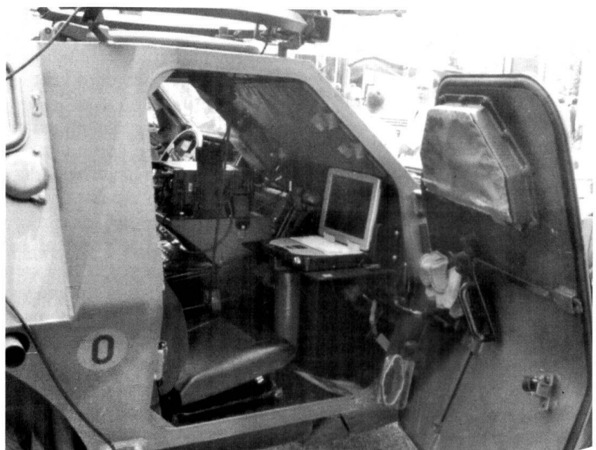
Le SIT EADS destiné aux véhicules d'exploration, ici le VBL.

■ L'ex Matra, aujourd'hui partie d'EADS, est à l'origine du SIR . Ce système est sensé faire le lien entre les différents SIT , à l'échelon du régiment, puis communiquer avec le SIC.F évoqué plus haut, même si cette architecture à trois niveaux n'est guère efficace. Au niveau tactique, EADS dispose d'un système destiné en priorité à l'infanterie ou aux unités