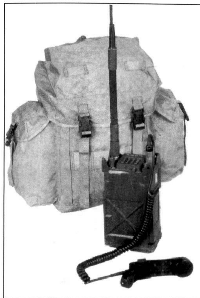
AN/PRC-119E, la version portable du SINCGARS d'ITT. Le même appareil est couplé à un amplificateur pour être monté dans un véhicule.

Deuxièmement, la miniaturisation. Le passage de l'analogique au numérique, s'il s'est accompagné d'un substantiel accroissement de performances, ne semble pas avoir amené la miniaturisation souhaitée. Même si le passage de la SE-412/SVZ-B à la SE-235, m2+ représente une réduction de volume et de poids de l'ordre de 75%, ce qui n'est pas négligeable ! A l'avenir, au fur et à mesure que l'on s'approchera de l'idée du combattant numérique, ces contraintes vont devenir draconiennes. Les radios du futur, comprenant l'interfa-