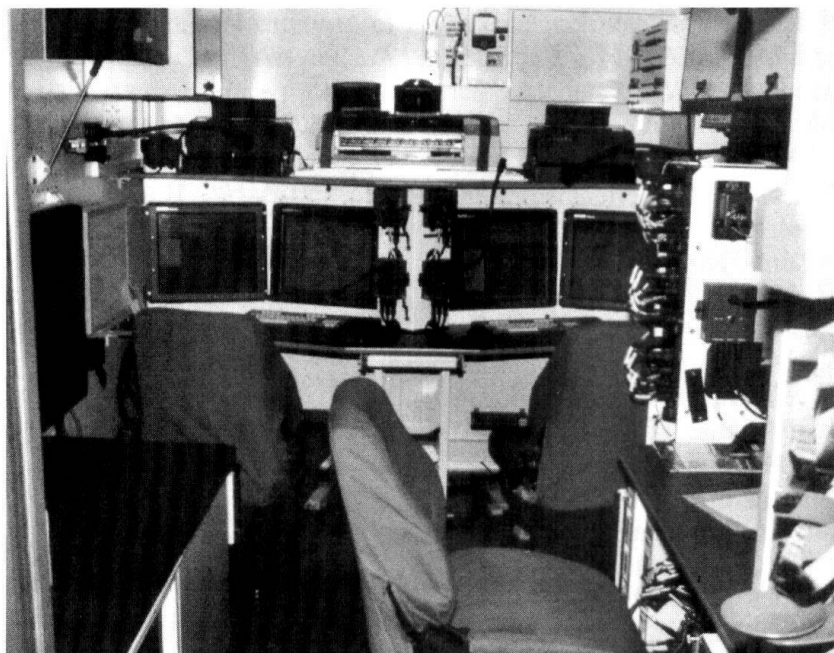
L'intérieur de Radio Access Point (RAP) de Thales Suisse.

Chaque bataillon nécessite au minimum un véhicule pour relayer ses trois réseaux de conduite, de renseignement et d'appui feu (ABC). Les RAP ne peuvent établir de liaisons qu'à l'arrêt, car il leur faut déployer un mât au bout duquel se trouvent des paraboles d'ondes dirigées. Les véhicules travaillent donc par paire, et une coordination est nécessaire