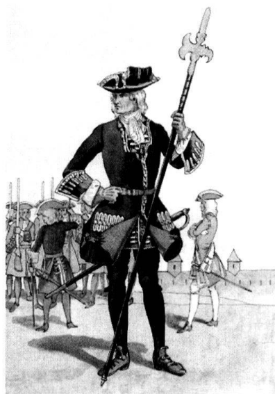
Sergent du régiment de Chandieu-Villars au service de France, ordonnance de 1701

Un mémoire présenté le 3 octobre 1734 nous apprend