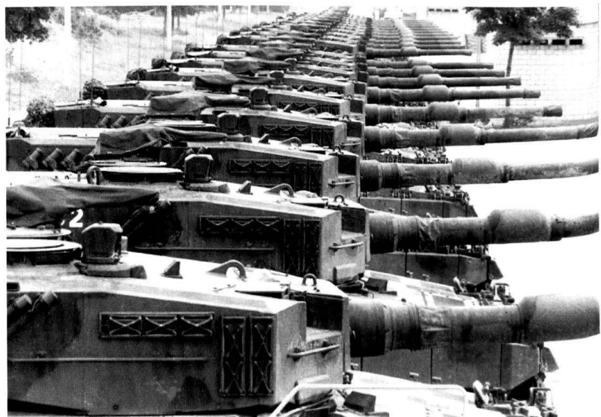
... et l'on réduit le contenu des arsenaux et des parcs.

En second lieu, d'estimer le temps nécessaire à la mise sur pied du personnel militaire ainsi que du temps destiné à son instruction.