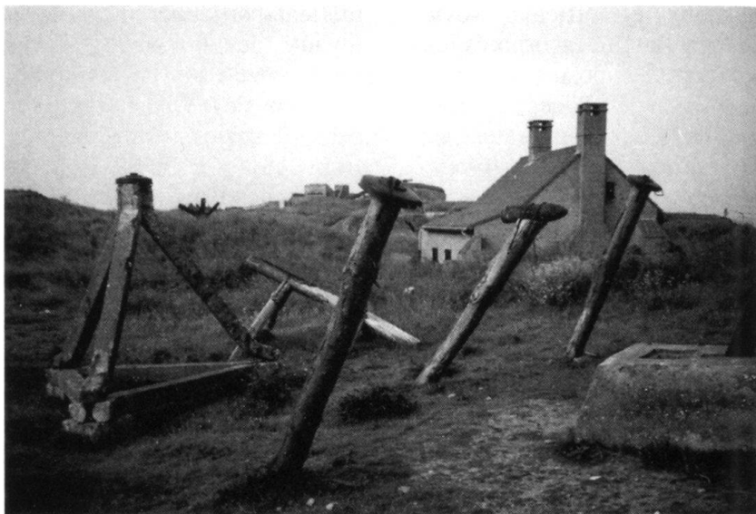
Domaine de Raversijde: les «asperges» de Rommel prévues pour les plages de débarquements.

Durant cette période, les dirigeants roumains font preuve d'une loyauté totale envers Moscou, appliquant scrupuleusement la ligne politique définie par le Kremlin. Après la création du Pacte de Varsovie en 1955, ils réussissent, petit à petit, à prendre une position distincte, la première étape