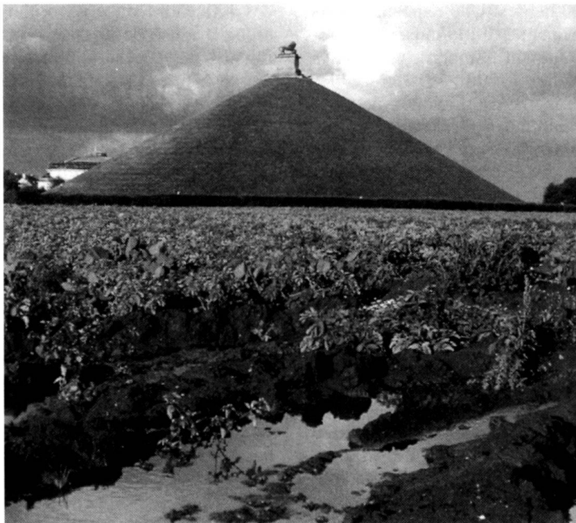
Champs de bataille de Waterloo: la Butte du Lion.

Moscou intervient militairement à plusieurs reprises pour empêcher que l'ordre social communiste soit balayé par les populations des Etats-satellites auxquels la «doctrine Brejnev» n'accorde qu'une souveraineté limitée: en Allemagne de l'Est (1953), en Pologne (1956), en Hongrie (1956), en Tchécoslovaquie (1968).