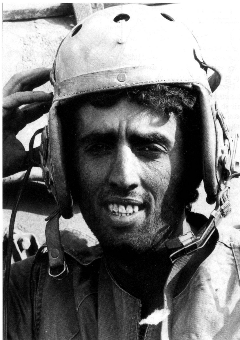
L'épuisement, la douleur et le stress se lisent sur le visage de ce pilote de char du 77 e bataillon.

par eux. En ces temps «préhistoriques» d'avant la guerre du Golfe, avant que des systèmes d'acquisition de but par laser ne fassent de la recherche d'un but un acte guère plus compliqué qu'un jeu vidéo, un adversaire que l'on a manqué découvrir la position du char qui vient de tirer et peut riposter. Si l'on est chanceux, on peut l'atteindre au deuxième coup, avant qu'il ne puisse ouvrir le