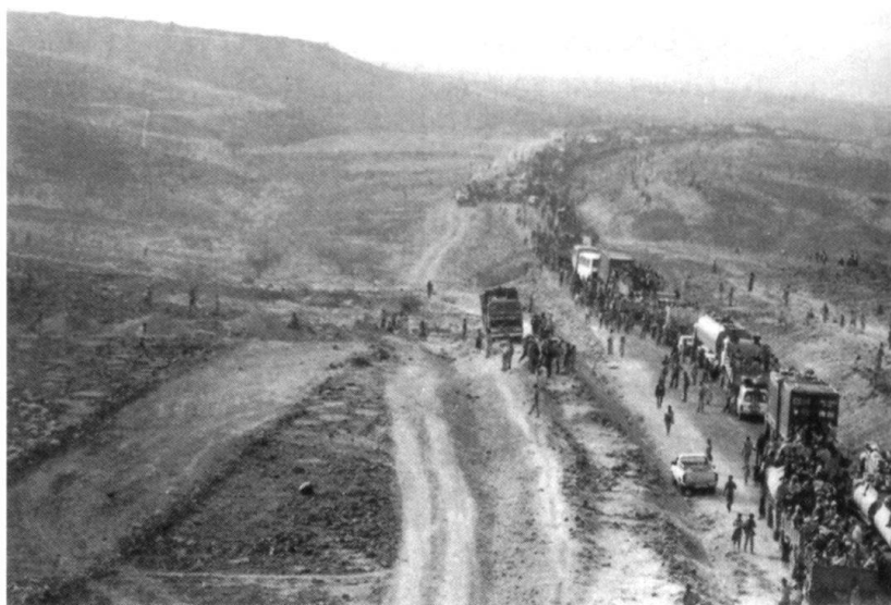
Colonne de réfugiés en Afrique.

Une autre menace sécuritaire, déjà bien concrète, est la guerre informatique, qui comprend deux volets. Le premier, l'«intelligence économique», renseigne les entreprises nationales sur les marchés à conquérir. Le second, «l'action» recouvre le vol, la destruction, le sabotage des fichiers de clients, des logiciels de gestion et de management des entreprises, les manipulations des paiements électroniques. La prise en otage d'un satellite qui n'était qu'une fantaisie à la James