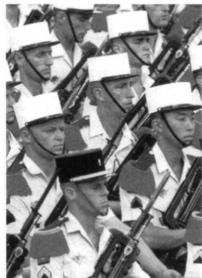
Défense ou sécurité?

ques dans le Caucase, en ex-Yougoslavie et en Afrique dans les années 1990, sans parler de l'interminable guerre israélo-arabe, nous avons une préfiguration de l'avenir. Des ethnies trop différentes ne peuvent cohabiter; de plus, l'islam conquérant ne veut que la première place. Même dans une société laïque de tradition chrétienne comme la France, l'islam est, non seulement la deuxième religion, mais il a réussi là où le catholicisme a échoué: il a cassé la laïcité. Alors qu'en France, les lois de 1936 interdisaient le port de marques religieuses à l'école publique, l'islam les a imposées avec le tchador. Certes, il a bénéficié de la complicité de certains membres du Conseil constitu-