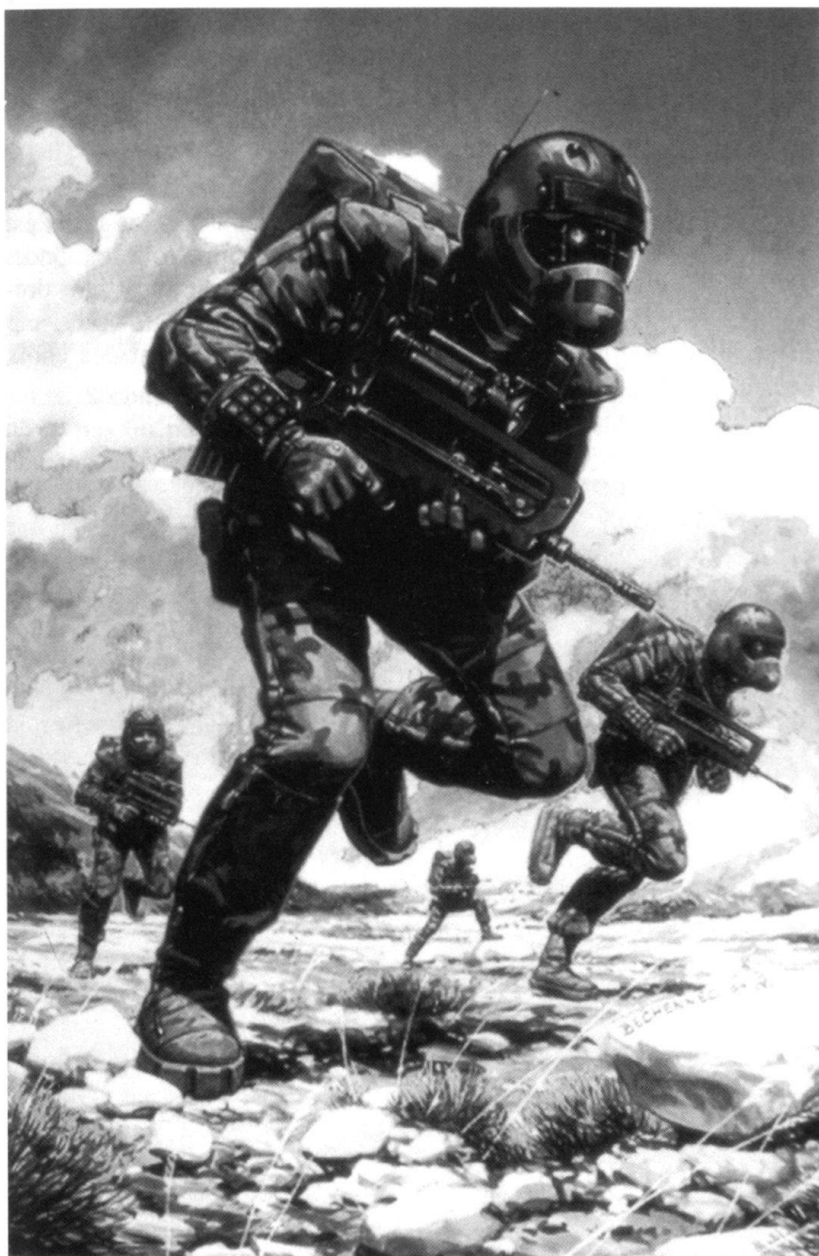
Tenue et équipement du fantassin de demain...

Les opérations militaro-humanitaires des années 1990 ont montré que des militaires n'étaient pas faits pour ce type de mission. Ils n'ont pas pu empêcher les massacres quand les antagonistes voulaient se battre. Une analyse fine et renseignée de ces engagements sous la bannière de l'ONU ou de l'OTAN montre qu'ils cachaient des intérêts autres qu'humanitaires. Néanmoins, dans le grand public ou chez les politiques qui n'ont pas le temps de se renseigner, cela fait bien d'avoir une armée humanitaire.