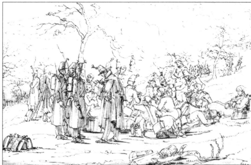
Aux avant-postes à La Corbaz, près de Fribourg, pendant le Sonderbund. Après la capitulation, il y aura réconciliation.

La question demeure pourtant ouverte de savoir si la recherche permanente de notre équilibre intérieur par la conciliation et la réconciliation n'a pas gravement retardé l'ouverture de la Suisse au monde. Non qu'elle ait refusé de participer à la solidarité internationale, à la gestion des crises ni à l'entraide humanitaire, tant s'en faut! Des institutions comme la Croix-Rouge, des engagements humains et financiers internationaux peu courants de la part d'un pays qui ne fait pas partie de l'ONU, mais aussi de multiples collaborateurs sur les lieux des conflits et les structures de réflexion et de communication mises à disposition de tous par notre pays témoignent du contraire.