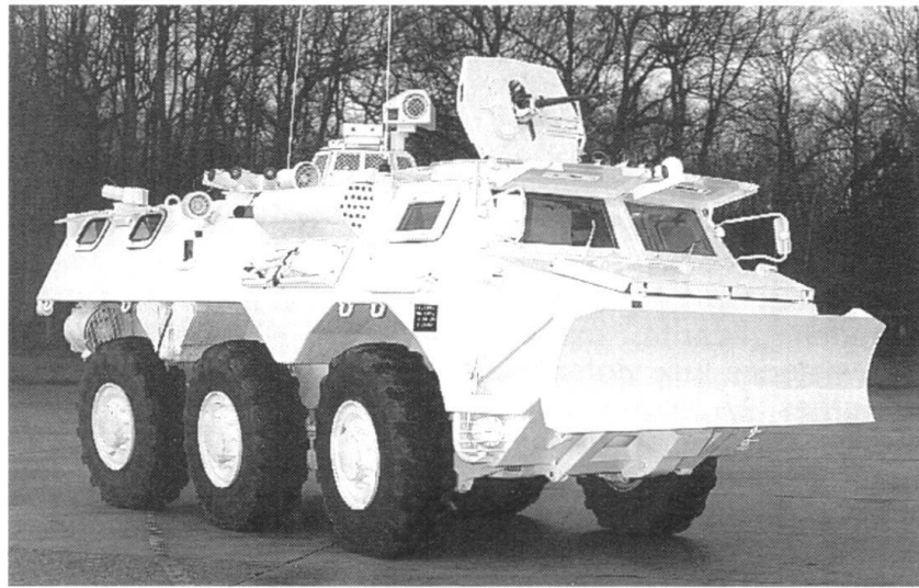
Galix : système de défense pour le maintien de l'ordre.

Le commandement devient de plus en plus centralisé, les décideurs ne se trouvant plus immergés dans le feu de l'action. Les hommes des forces de l'ordre ne parlent jamais aux manifestants. Ce faisant, ils donnerait à penser qu'ils prennent fait et cause pour les contestataires. L'intimidation présuppose une organisation, dont l'invisibilité de la mise en place du barrage. Dès la descente des véhicules, l'uniformité des gestes commence. Il