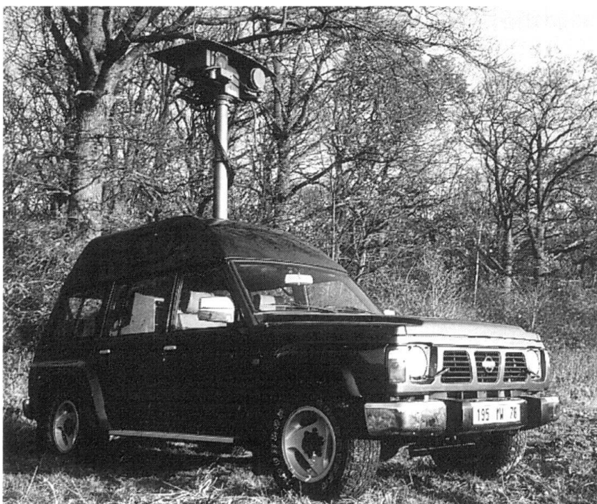
Système de surveillance optronique mobile.

Les moyens engagés visent à saturer les sens des manifestants, à les rendre inopérants pour quelque temps. Les fourgons-pompes refroidissent les ardeurs, les gaz gênent la respiration ou piquent les yeux. Les engins fumigènes ou détonants, les projecteurs à forte puissance, les sirènes hurlantes pertur-