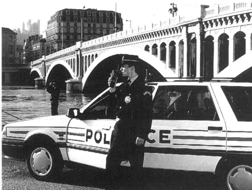
Réseau ACROPOL : utilisation du terminal portatif (Photo: Matra Communication).

Les événements de mai 1968 montrent que l'équi-