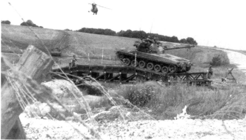
Depuis 1968, les formations blindées disposent de la place d'armes de Bure et des excellentes possibilités qu'elle offre pour entraîner les mouvements dans le terrain.

2005, date prévisible d'une Europe ayant passé du projet à la réalisation.