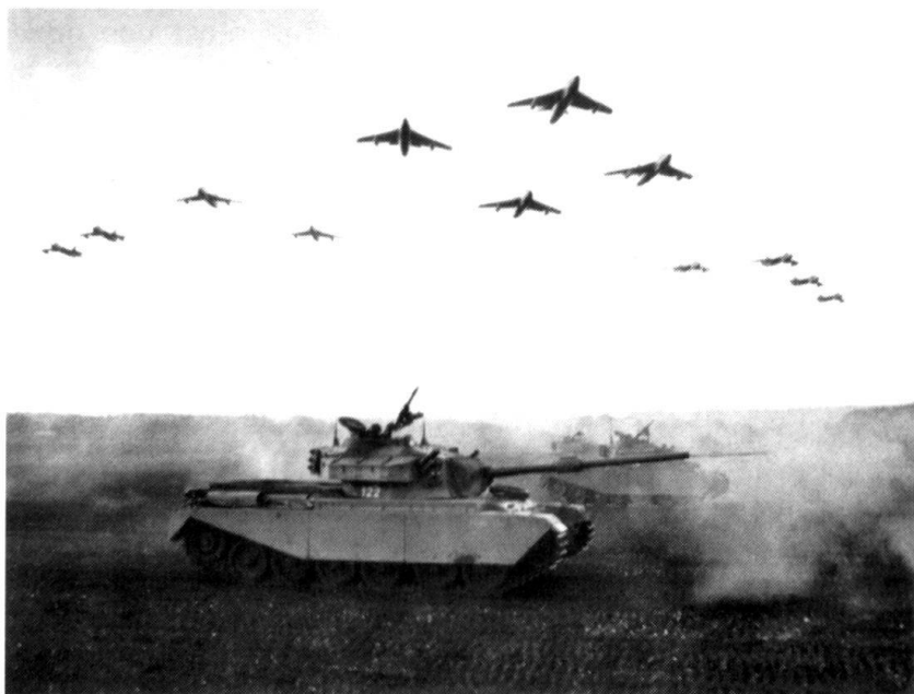
Les divisions mécanisées, fer de lance des corps d'armée de campagne, sont d'abord équipées de chars Centurion. Un de ces engins survolé par des Hunter pendant un tir combiné à Bière en 1964 (Exposition nationale).

La situation défavorable de nos finances fédérales a facilité la décision, si elle ne l'a pas imposée, voire accélérée, car l'on avait d'abord, dans les milieux proches de l'armée, pensé à une réforme vers l'an