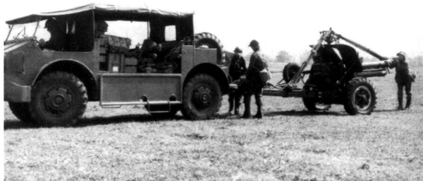
C'est avec l'Armée 62 que l'artillerie tractée cède progressivement sa place aux obusiers blindés, du moins dans les formations de plaine.

Car chacun sait que l'instruction est affaire des