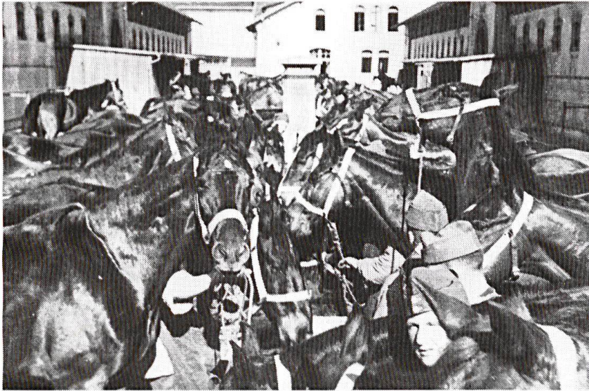
Aarau. Un escadron à l'abreuvoir.

pied à terre». La cavalerie n'était plus nécessaire; elle n'était même plus guère viable. Il serait pourtant injuste qu'on ne garde d'elle qu'un souvenir folklorique. Pendant des siècles, elle a été l'Arme de la décision; l'esprit cavalier, fait de hardiesse et de vues lointaines, a inspiré de grands capitaines. La nostalgie des anciens est donc justifiée, car elle ne se nourrit pas seulement du charme qu'il y avait à servir à cheval. Aujourd'hui il importe qu'ils aident leurs après-venants, qui «montent» des chars, à ressentir le même feu sacré.