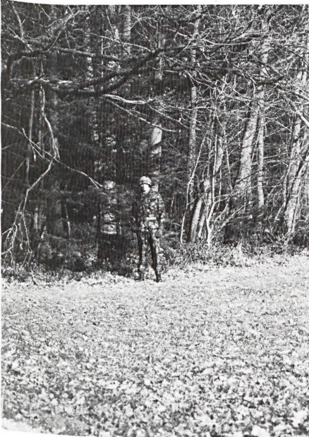
Longeant la lisière, ce soldat est, à distance égale, moins visible. Il se trahit en revanche par la tache claire de son visage.