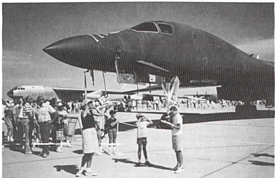
Les bombardiers B-52 (à gauche) et B-1 sur la même base.

La sécurité du Moyen-Orient s'inscrit dans un large contexte. Les causes intérieures d'instabilité sont nombreuses. Dans cette région du monde, les conflits prennent des dimensions multiples et seul un processus de pacification long et patient, réalisé par étapes successives, permettra d'aboutir à des résultats. Il faut