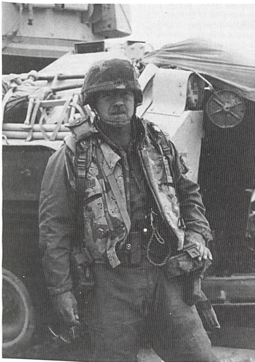
Un homme de la 3 e division blindée américaine au sud de l'Irak, dans la région de Safwan.

dans un monde toujours plein de dangers et de menaces, il s'agit de créer des forces armées plus petites, plus mobiles et plus techniques pour défendre les intérêts des Etats-Unis.