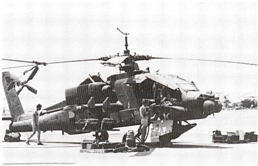
L'hélicoptère de combat AH-64 Apache, «point d'appui volant» en Arabie saoudite pendant l'opération «Desert Storm».

1. A une époque d'évolution et de changement,