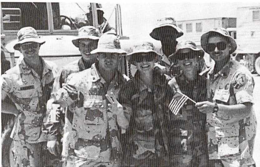
Des hommes de la 1 re division d'infanterie (mécanisée) en Arabie saoudite (Photo LFC).

Clinton est d'avis que les citoyens américains, habitués à comparer les coûts et les rendements, peuvent être convaincus de la nécessité d'une défense militaire substantielle à une seule condition: que l'armée soit utile au pouvoir politique. Dans chaque cas, il convient de se poser deux questions. Existe-t-il un danger que l'engagement de forces militaires sur des objectifs restreints provoque une escalade? La menace d'intervention par la force militaire a-t-elle un effet coercitif suffisant pour obtenir d'un agresseur ou