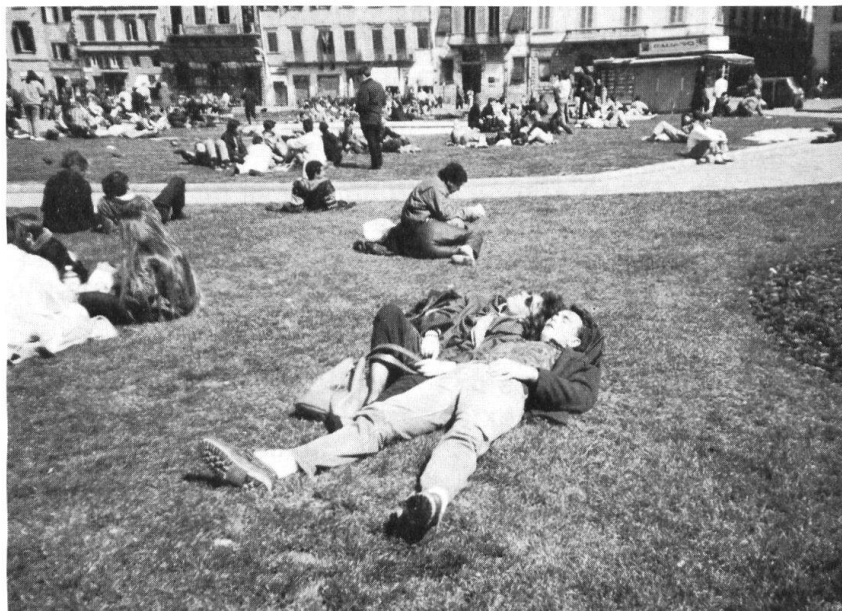
En Europe occidentale, donc en Suisse, une jeunesse très «cool», élevée dans l'abondance, a beaucoup de peine à accepter ses obligations face à l'Etat. Ce couple de jeunes fait un somme sur une pelouse de Florence, devant l'église de Santa Maria Novella... Subir une discipline de style militaire ne manquerait pas de créer chez eux révolte et stress...

»Deuxième point à améliorer: réduire le plus possible les pertes de temps. Si l'on considère le nombre de jours perdus à nettoyer, déménager, installer des places de tir, recevoir du matériel que l'on n'utilise pas, on arrive à une école de recrues raccourcie de plusieurs semaines. Pourquoi ne pas utiliser à ce genre de tâches les per-sonnes incapables de suivre normalement, pour des raisons physiques ou intellectuelles leur école de re-crues, en les sélectionnant après quelques jours d'armée? Il serait alors possible de pousser un peu plus l'entraînement des autres éléments (...).»