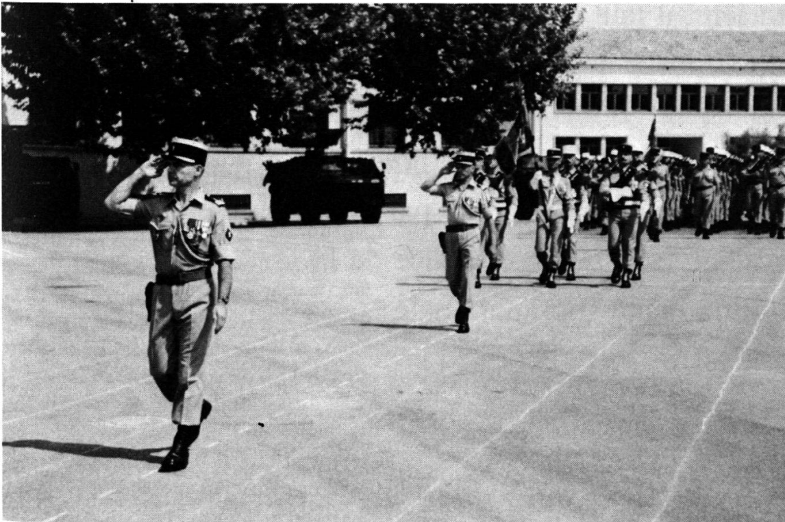
Ouvrant le défilé, le commandant, son second, l'étendard et sa garde précèdent le premier des escadrons