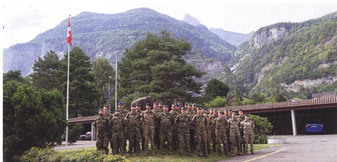
Etat-Major du Concours d'armée 25 à St-Maurice (VS).