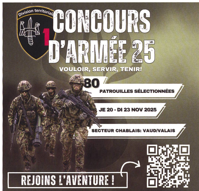
Flyer du CA25.