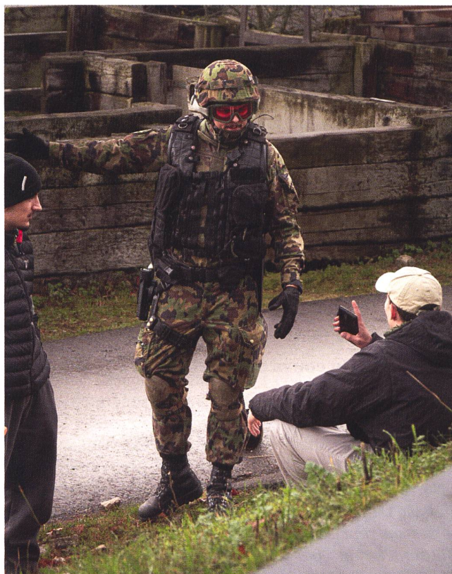
Sécurisation de bâtiment. Semaine d'endurance. E PM 19-2/24 Sion.