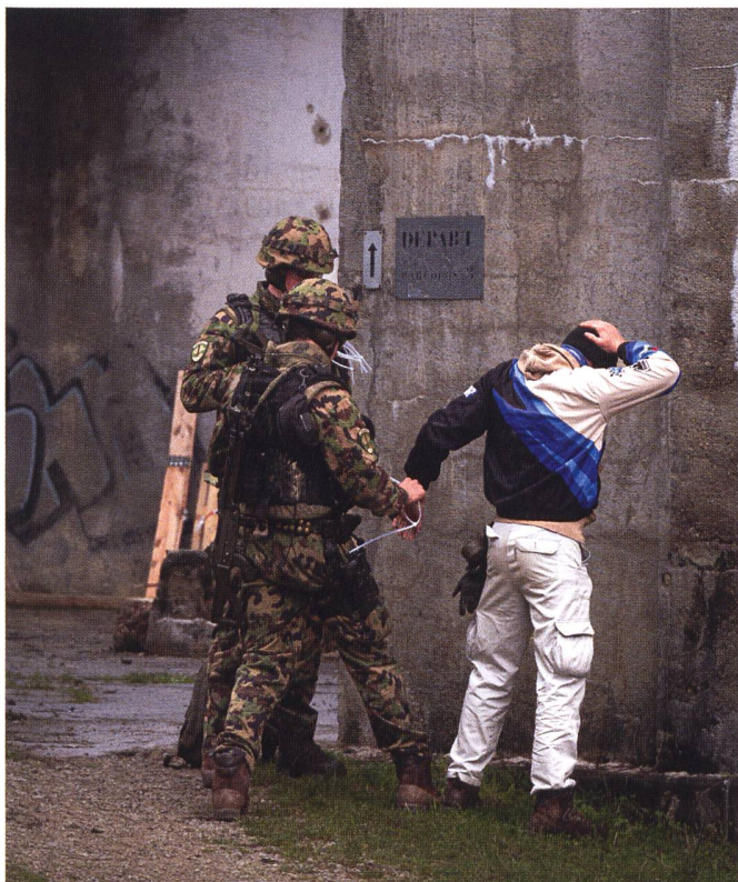
Arrestation d'un civil. Semaine d'endurance. E PM 19-2/24 Le Day.