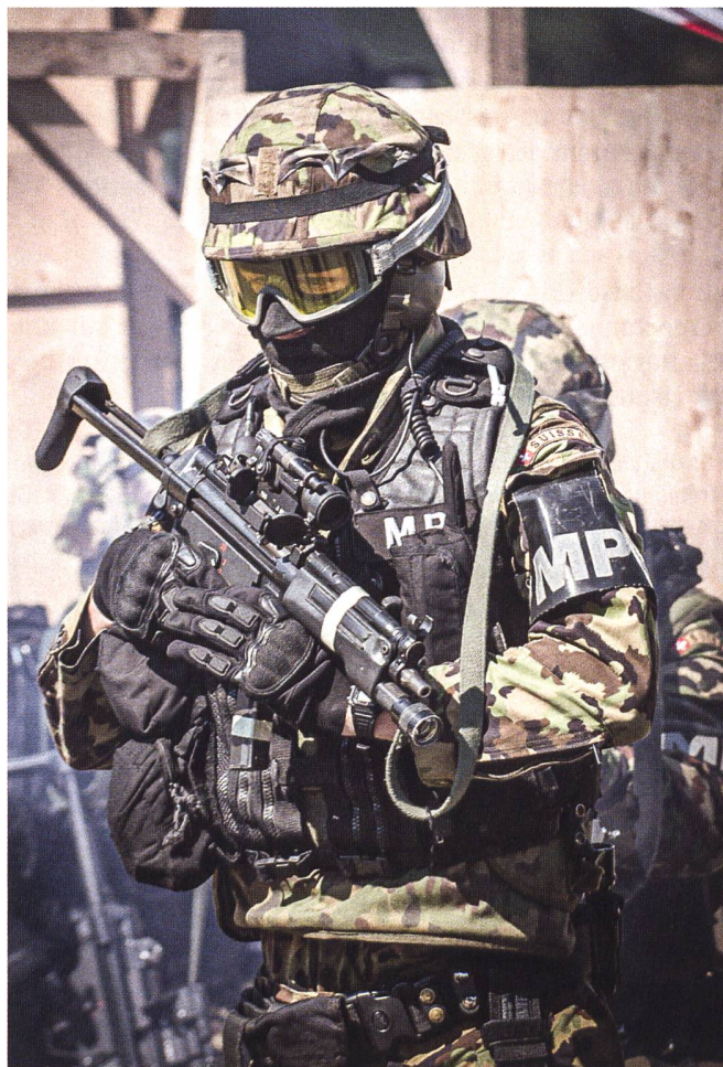
Soldat grenadier de la police militaire.