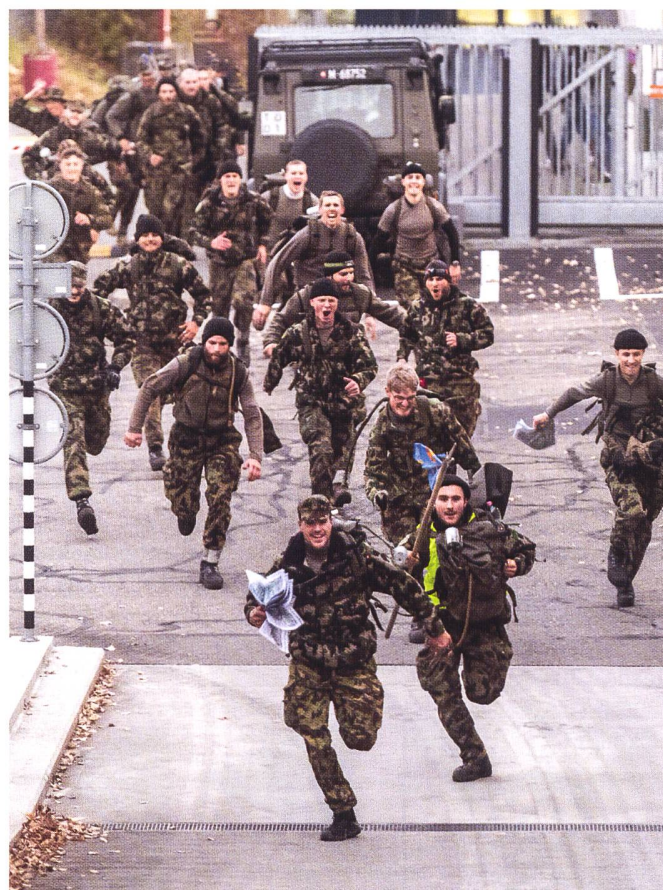
La marche des 101km conclut la semaine d'endurance des aspirants officiers. Sur la photo, la classe DELTA termine sa marche avec la montée de la rampe de la caserne de Liestal (BL). EO inf 10-2/21.

Elles ont été proposées à l'origine par des aspirants et institutionnalisées en 2004 par l'ancien commandant des écoles de cadres, le colonel EMG D. Jolliet. 1 Bien que la