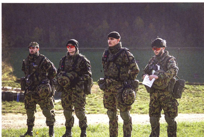
Critique d'exercice. EO inf 10-2/22.

Plus important que la terminologie ou le catalogue précis, le futur officier se rend compte que de nombreuses décisions, et souvent les plus difficiles, d'un cadre ne peuvent pas être prises par des considérations exactes et objectives, ni même par des directives réglementaires. Souvent, il s'agit plutôt d'une réflexion personnelle et l'officier doit pouvoir défendre sa décision non seulement face à ses supérieurs, mais aussi face à ses subordonnés, à la population et à lui-même. Pour cela, une boussole intérieure est nécessaire - et les 12 valeurs de l'officier d'infanterie peuvent être utiles pour la développer.