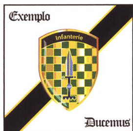
Le drapeau de compagnie EO inf 10.

Les armoiries de l'école se composent dans leur partie principale d'un poignard en fer dressé sur un écusson entrelacé de vert et d'or en 64 champs, surmonté en or de l'inscription « Infanterie » sur un arc noir. Le poignard est une stylisation de la dague d'antenne en fer de l'époque Hallstatt d'Estavayer-Le-Lac FR (STÄFFIS am See), découverte en 1962 et datée par le professeur Dr Othmar Perler de la deuxième moitié du 6 e siècle avant Jésus-Christ.