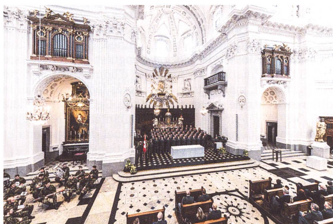
Cérémonie de promotion des aspirants au grade de Lieutenant à la Cathédrale Saint-Urs (SO). EO inf 10-2/21.

« Perdre n'est pas une option pour un officier d'infanterie » Devise