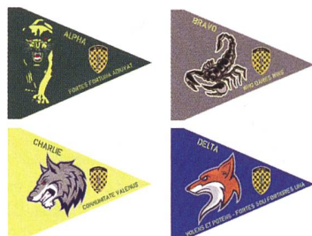
Les quatre fanions de classe.

Le poignard représente le combat rapproché, la caractéristique essentielle du combat d'infanterie. De par son origine datant de l'âge de fer pré-romain, il montre la tradition et l'ancrage de notre genre d'armes. L'échiquier représente la tactique, le métier d'officier en tant qu'enseignement de la conduite de différentes armes