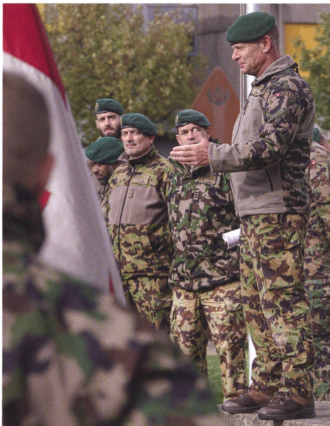
Inspection de l'E PM 19-2/23 par le cdt FOAP inf.