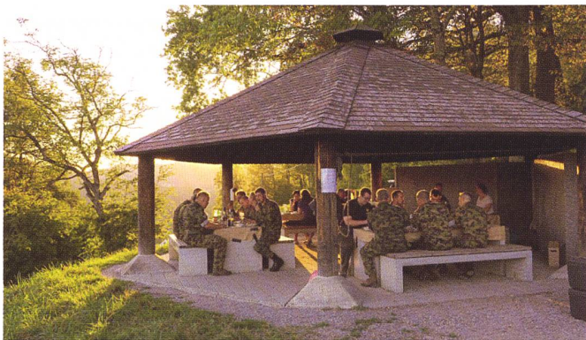
Souper dans le terrain des militaires de carrière et collaborateurs de l'EM FOAP inf lors du Rapport annuel inf 2023.