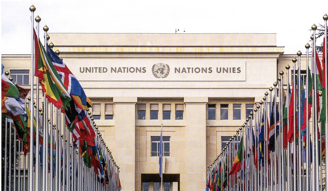
Le siège des Nations Unies à Genève.