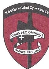
Visite du chef du Commandement des opérations au contingent 49, en mars 2024.