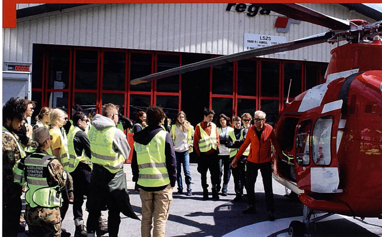
Connaissance des partenaires de la chaîne des secours en Suisse.