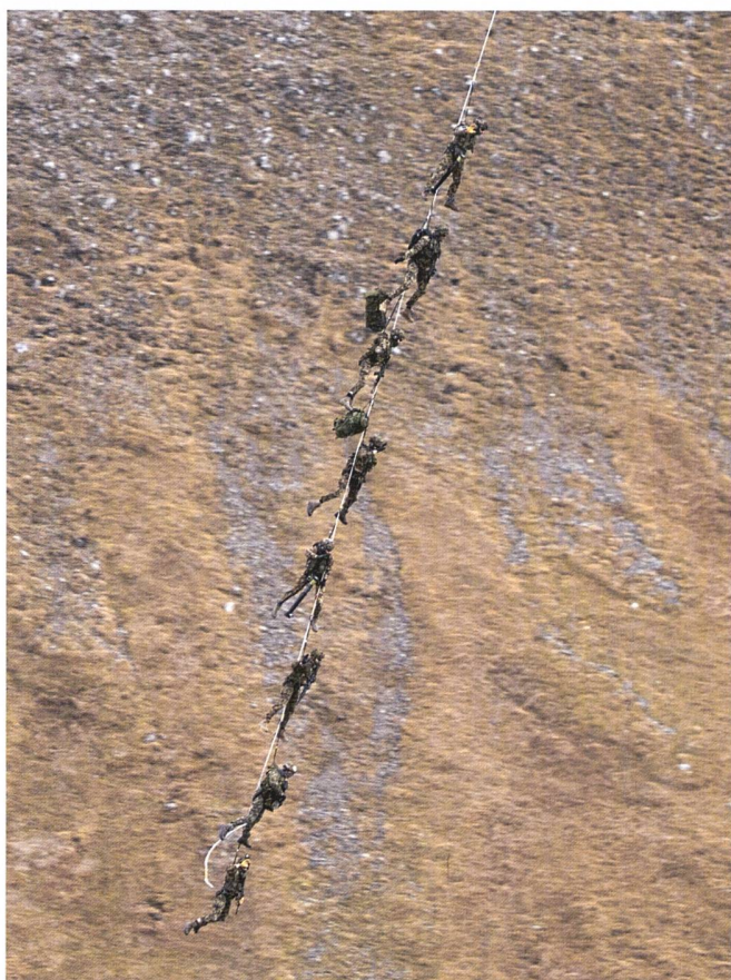
Extraction d'une unité du Commandement des Forces spéciales par un Super Puma.