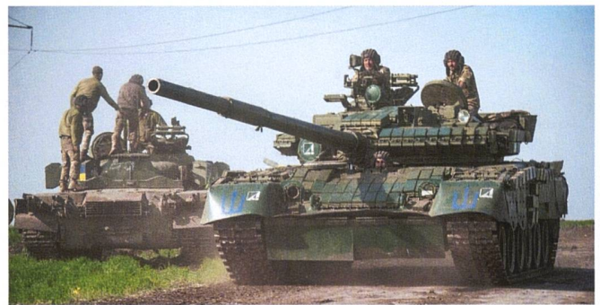
Un T-80BV ex-russe aux mains de la 93 e brigade mécanisée, en mai 2022.