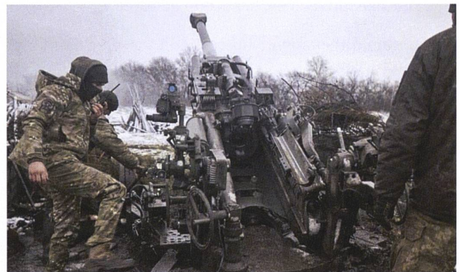
Un M-777 en action dans le Donbass fin novembre.

Le BTR-4 développé en Ukraine sert principalement dans les unités parachutistes.