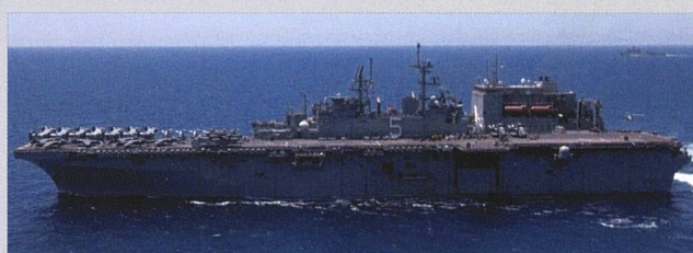
De haut en bas : CVN-78, CVN-69 et LHD-5 de l'US Navy.

au Liban, en Syrie, voire en Iran. 1 L'escadrille est basé à Davis-Monthan AFB dans l'Arizona ; depuis 2015, elle a régulièrement déployé des appareils en Europe dans le cadre de la mission ATLANTIC RESOLVE consécutive à la guerre de Crimée.