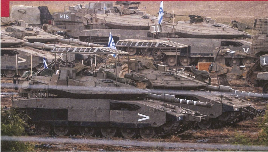
Ces Merkava 4 M de la 401 e brigade blindée ont mobilisé et se préparent aux actions de grande ampleur qui doivent répondre aux massacres du 7 octobre 2023 par le Hamas.