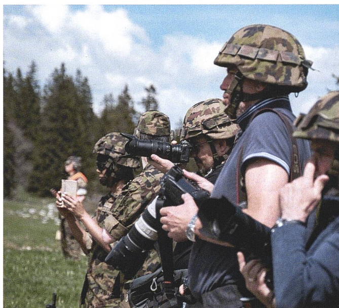
Ci-dessous: La presse est présente – et équipée – aux Pradières. L'exercice a généré de nombreux articles dans la presse régionale et nationale.