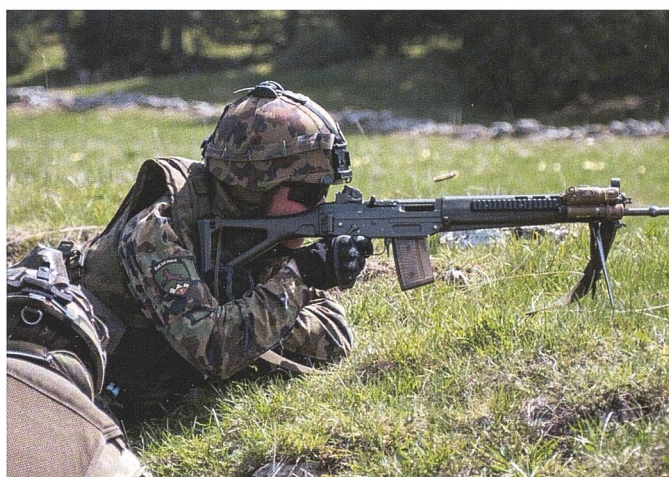
Ci-dessus: Elements de la 2 e compagnie, progressant à travers Planeyse.