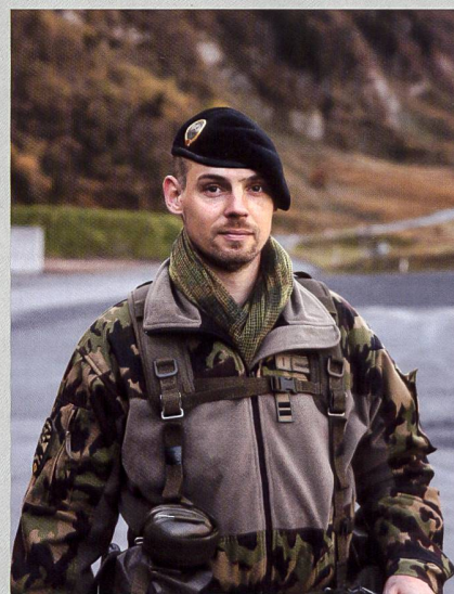
Bat sap chars 1