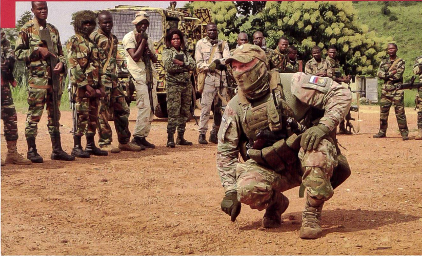
Instruction de base assurée par des entreprises militaires russes en Afrique de l'Ouest.