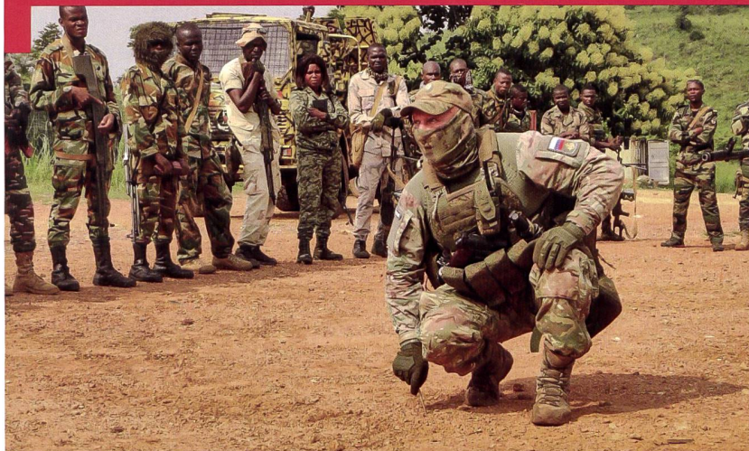
Instruction de base assurée par des entreprises militaires russes en Afrique de l'Ouest.