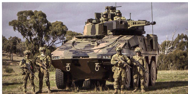
Le Boxer remplacera l'ASLAV dans le rôle de véhicule blindé de reconnaissance 8x8. Mais les autres plateformes seront chenillées.