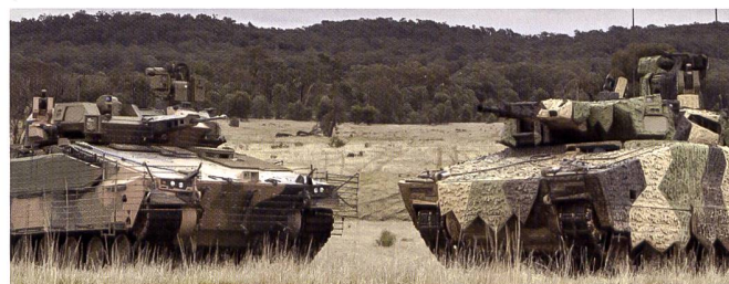
Comparaison des deux compétiteurs pour le programme LAND 400 Phase 3 : à gauche l'AS-21 et à droite le KF-51.

Décembre 2021 : Essais des deux engins pour évaluer leur capacité de projection maritime.