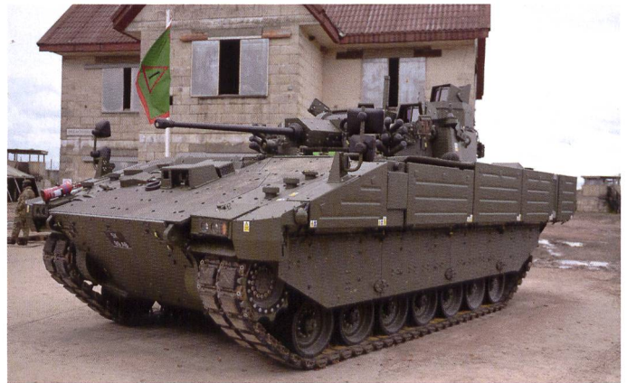
Essais à la troupe de la version de reconnaissance et de combat.

La version VTT a également fait l'objet de certaines évaluations, avec une douzaine d'engins livrés.