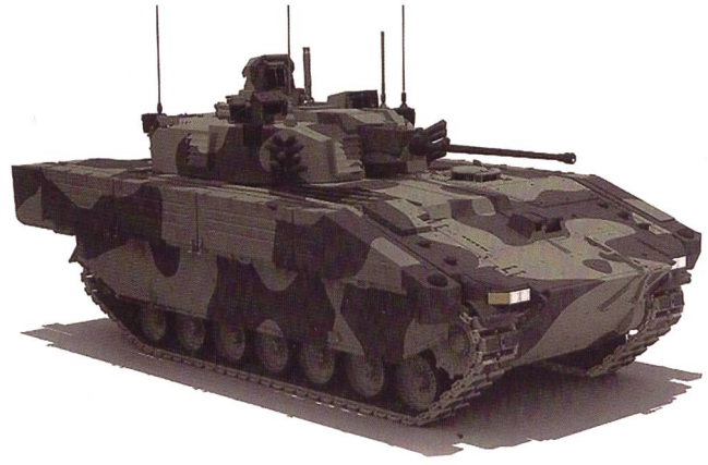
Image de synthèse montrant la configuration de l' Ajax et de sa tourelle de 40 mm.

Aperçu de la famille d'engins, avec les versions spécialisées dans le domaine de la reconnaissance et du Génie.