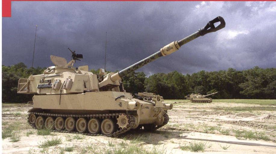
Le M-109A6 est la version standard de l'US Army, introduite à partir de 1994.