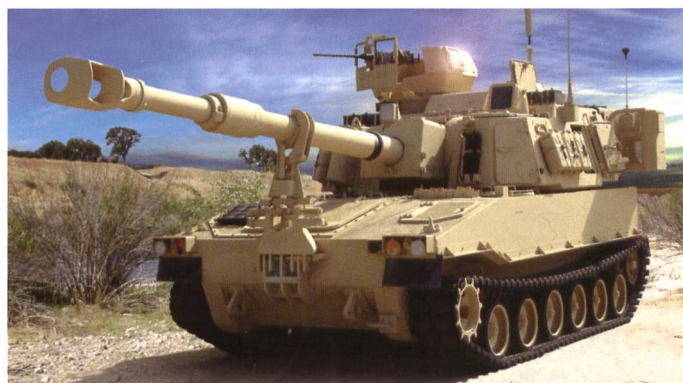
Prototype du M-109A7 disposant de protections supplémentaires, d'un nouveau châssis – identique au M2/M3 – et d'une électronique améliorées.

Le M992A3 est un ravitailleur de munition : Field Artillery Ammunition Support Vehicle (FAASV) basé sur le même châssis que le M-109A6 ou ici, A7.