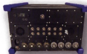
BS3: Ersa IMFS/Router 20