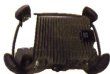
BS3: Ristl NG/R-990