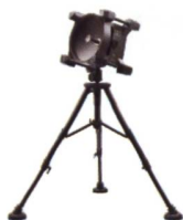
BS1: R-905 BB