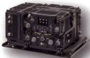
BS2: Ersa mob Komm/SE-495