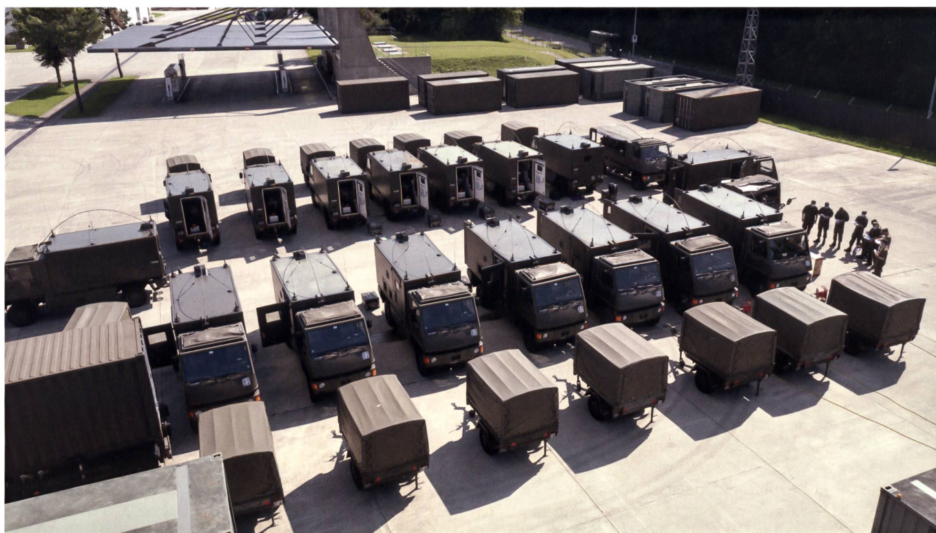
Mise en place d'un microdispo.

L'exercice LINK a eu lieu en juin 2021 dans la région de Winterthur et a eu pour but d'exercer nos troupes du bat aide cdmt 41 dans une situation réaliste. Après une donnée d'ordre, un exercice impliquant les moyens de télécommunication commence toujours par un contrôle de la fonctionnalité du matériel ainsi que la mise en place d'un Microdispo. Cette configuration a pour but de tester en miniature la réalité du terrain et de contrôler les paramètres des systèmes afin de s'assurer du bon fonctionnement du matériel. Tout ceci