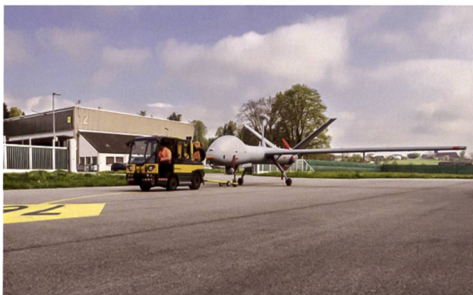
Hermes 900 lors de la présentation à Emmen

De novembre 2021 à début mars 2022, le premier groupe de douze pilotes issus des Forces aériennes (commandement de drones 84) et du domaine spécialisé Essais en vol d'armasuisse (Office fédéral de l'armement)