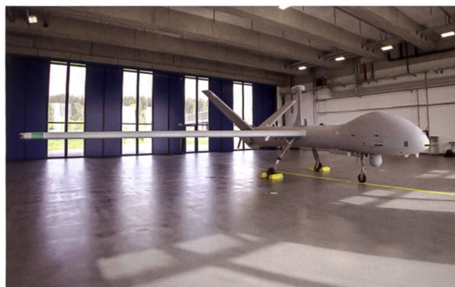
Les deux premiers drones à Emmen

En cas de défense contre une attaque militaire, l'ADS 15 contribue à la conduite et au contrôle des actions au sol, notamment pour l'appui par le feu. Outre les drones