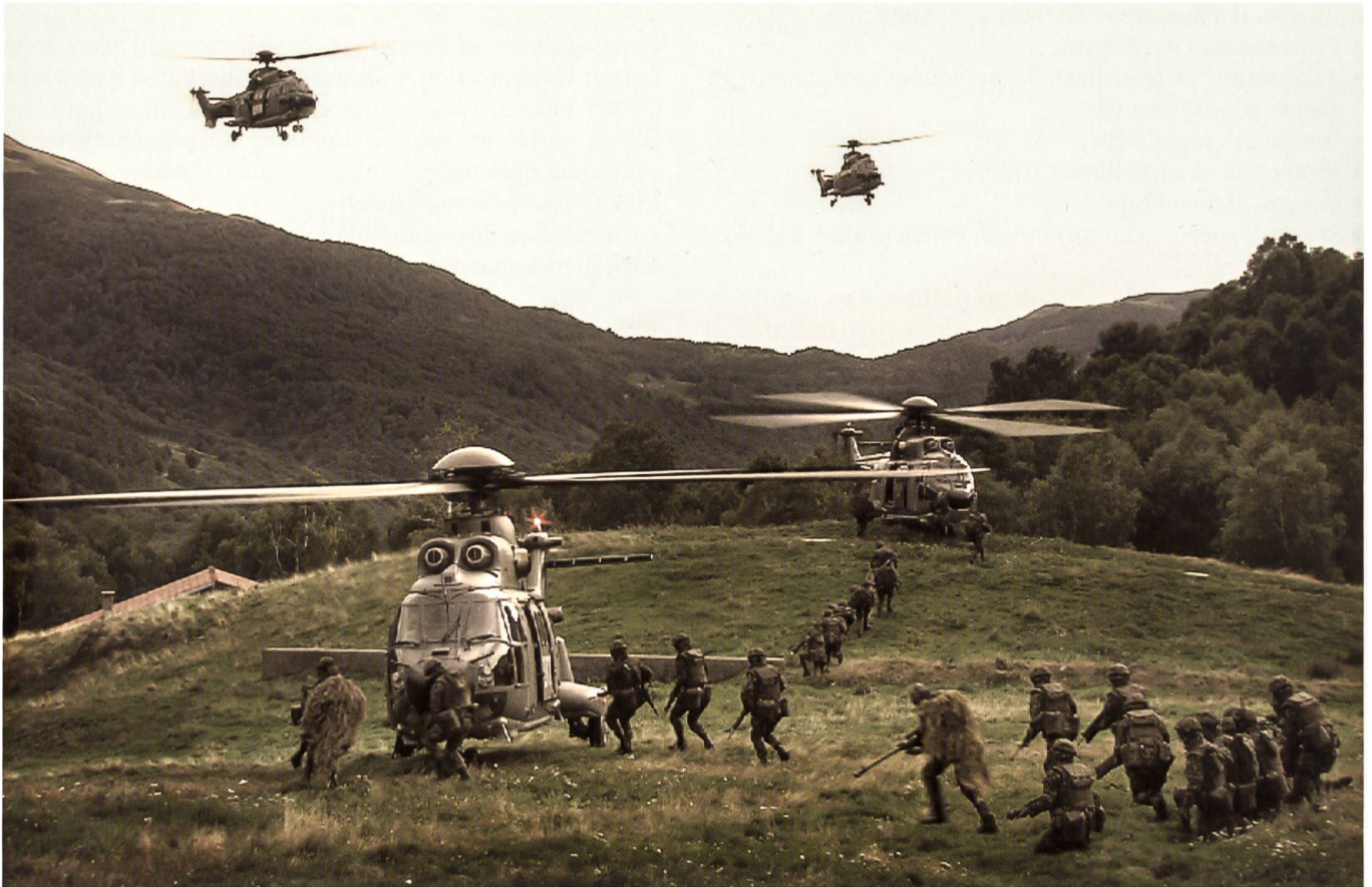
Ci-dessus : Embarquement dans des hélicoptères. Page suivante : Photos d'un exercice du bataillon de grenadiers 30.