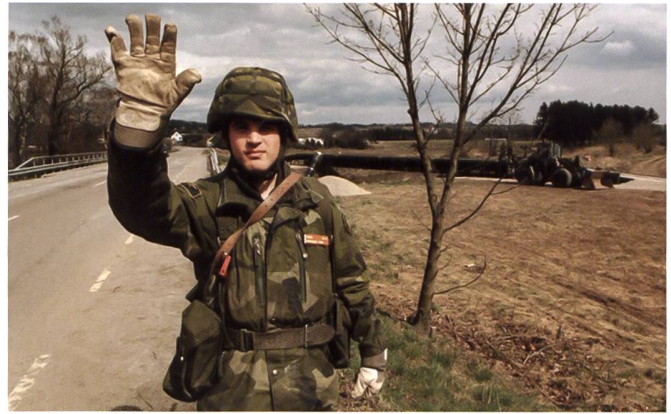
En plus de ses places d'armes, l'armée suédoise s'entraîne très fréquemment à des exercices de mobilité et de déplacements entre les régions du pays.

Plus récemment, la Suède et la Finlande, qui sont étroitement intégrées sur le plan de la défense, ont vu comment l'agression russe en Ukraine a créé un changement de paradigme dans les récits politiques