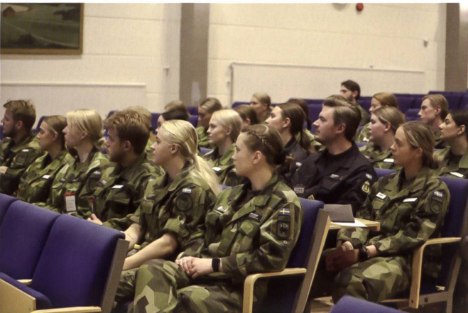
Le contingent de miliciens s'accroît chaque année de 4'000 personnes supplémentaires.