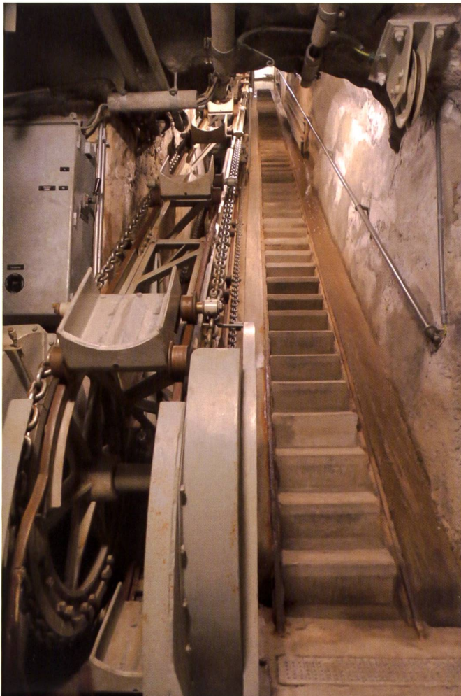
Le funiculaire de Dailly, hors service actuellement.