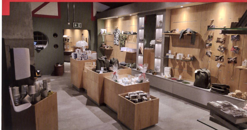
La boutique du Fort dans l'ancien magasin matériel.