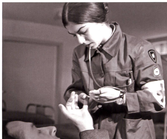
Ci-dessus : Laborantine SCR durant un CR(1975-1980)

Depuis ce jour nous sommes quelques 250 femmes justifiant d'une formation dans divers domaines de la santé, qui perpétuent de façon volontaire, une tradition, un héritage de toutes nos prédécesseurs qui avant nous se sont battues pour sauver des vies autant sur les champs de bataille de Solferino, durant les 2 guerres mondiales qui se sont succédées, que celles qui ont soigné durant l'épidémie de grippe espagnole.