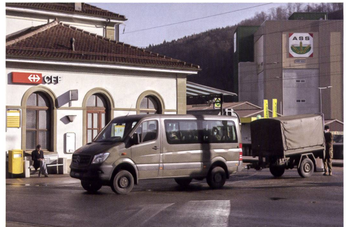
Entrée en service et relèves - la gestion du personnel a été un élément essentiel de la capacité des unités à l'engagement.