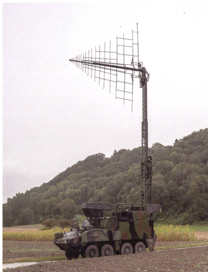
Ci-dessous : char MZS.

sur deux secteurs différents. Le dispositif a d'abord été déployé en Valais, puis démonté et déployé une nouvelle fois sur le canton de Vaud avant le démontage final. À tous les échelons, la pression s'est fait sentir : double planification, organisation de tours de gardes sur une durée plus conséquente, plus longue autonomie sur les emplacements extérieurs, gestion du temps de repos des chauffeurs, rythme de conduite intense. Ces différents challenges ont été relevés haut la main ! De plus, la situation sanitaire a imposé un cadre logistique plus contraignant puisqu'il a fallu jongler avec plus de PC arr qu'en situation normale.