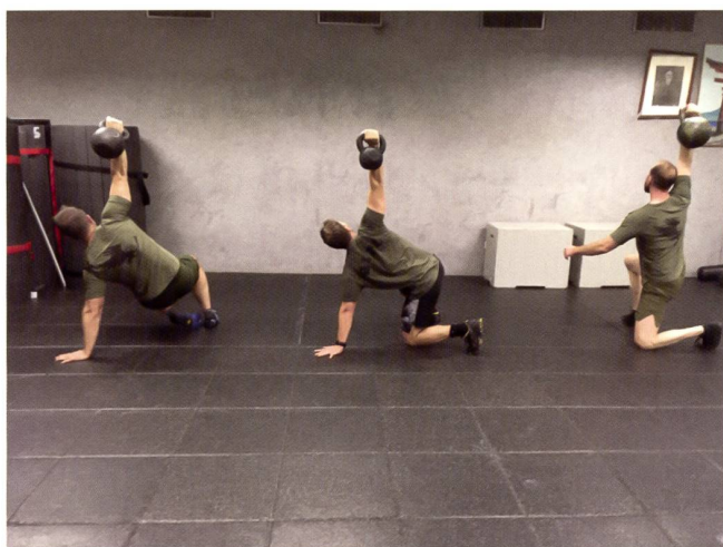
Opérateurs du Groupe d'Intervention de la Police de Lausanne (GIPL) pratiquant le get-up

Les pratiquants signalent des progrès significatifs en force et en endurance dans des exercices n'ayant pas été entraînés. 7 Les kettlebells forgent une force tout-terrain et rendent résilient.