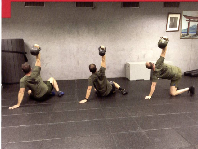
Relevé avec kettlebell.