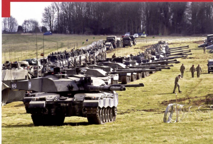
Un groupement de combat ( battlegroup ) réuni sur le terrain de manœuvres de Salisbury pour les manœuvres de la 3 e division britannique. On aperçoit sur cette photo une des deux compagnies de chars Challenger 2 .