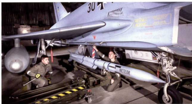
Le missile air-air à moyenne portée Meteor de MDBA est aujourd'hui employé sur l'Eurofighter. Mais en raison de son intérêt à l'exportation, il a été testé sous le Rafale (photo ci-dessous) et les Britanniques sont en train de l'homologuer sur le F-35 (photos du bas).