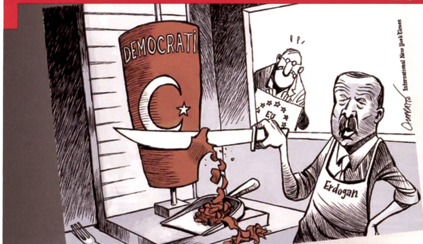
La Turquie vue par Chapatte.