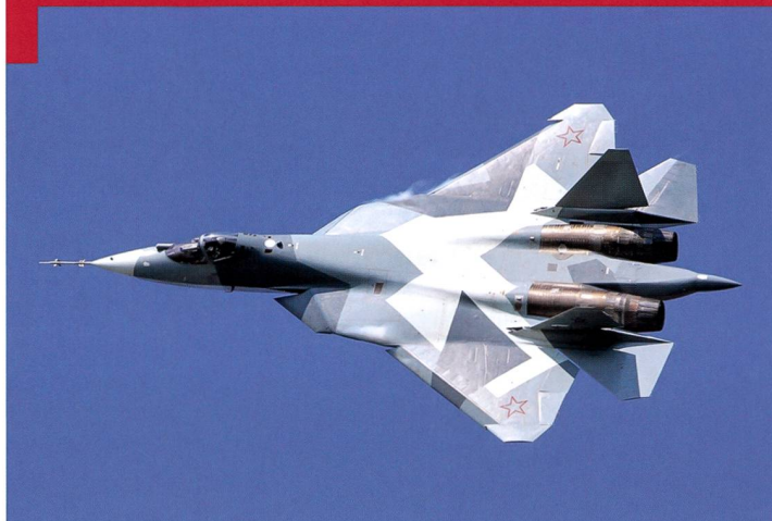
Sukhoi Su-57, peut-être le futur adversaire standard des F-35 et Superhornet