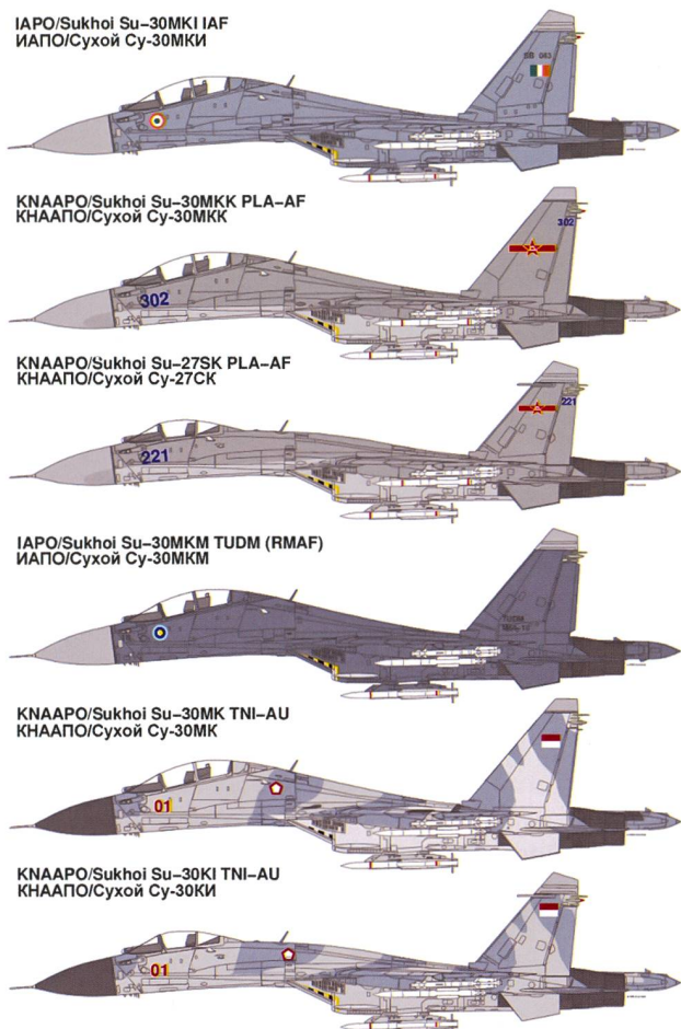
Les Su-30 dans leurs différentes versions présentes sur le théâtre asiatique.

jusqu'au secteur de combat. Pour éviter de retomber dans le piège du tout technologique, il recommande également des ruses de guerre pour être tenu informé, comme le fait de maintenir des observateurs équipés uniquement de téléphones mobiles et utilisant un langage basé sur la carte de commande de McDonald's pour dire combien de « Big Mac » ou de « Nuggets » décollent d'une base donnée, élément qui peut être complété par des navires d'écoute électronique, qui peuvent être camouflés en navires civils, le long du chemin envisagé par les appareils.