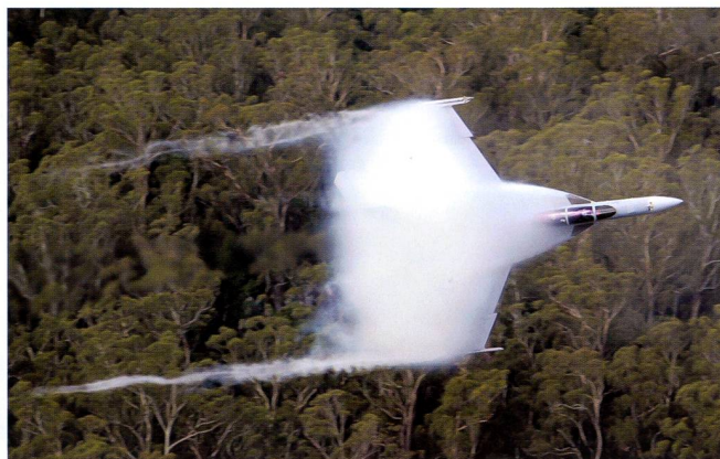
Superhornet en passage bas, démonstration que la nouvelle version n'a rien perdu en matière de manœuvrabilité par rapport à la version en service en Suisse.