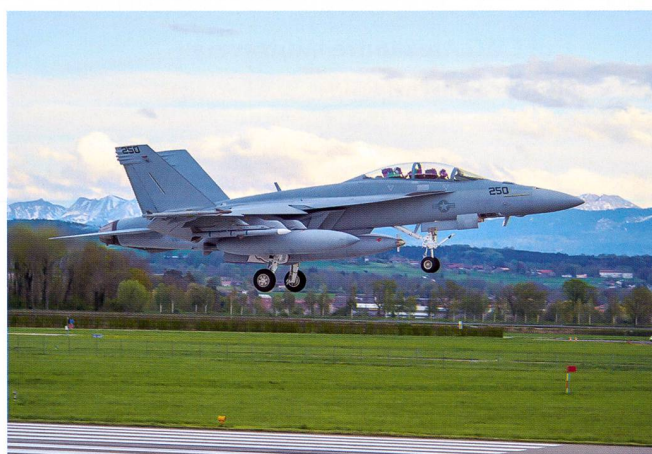
Superhornet en approche sur l'aéroport de Payerne lors des essais menés dans le cadre d'Air 2030

situation qu'il faudrait éviter, dans le cas d'un achat de Superhornet . En cas d'achat de cet appareil, l'autonomie stratégique du pays serait également plus réduite que par rapport à d'autres appareils capables d'emmener des munitions de divers types et de diverses provenances. Avec l'appareil de Boeing, il faudrait également se fournir en munition auprès de l'Oncle Sam. Le Super Hornet n'en garde pas moins toutes ses chances dans la course au remplacement de son respectueux prédécesseur.