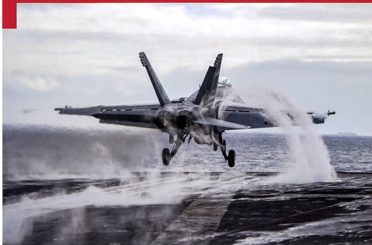
Superhornet de la Navy quittant le pont d'envol d'un porte-avion américain.