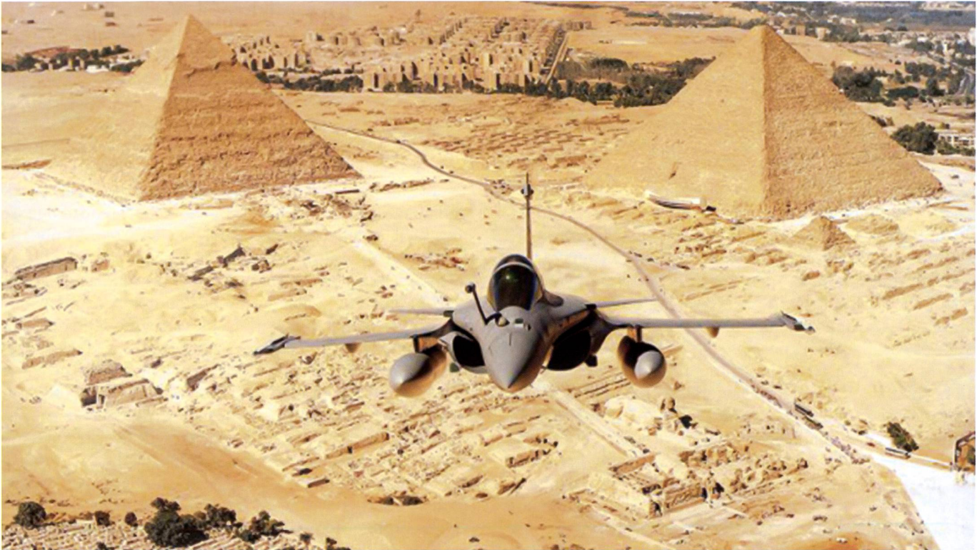
L'Egypte, premier client international à acheter le Rafale à l'export, où comment contempler 4'000 ans d'histoire depuis la 3 e dimension.

car Brasilia décida de l'acquisition de 36 appareils suédois Gripen . Comme pour le marché suisse, en 2014, le volet économique semble avoir poussé les Brésiliens vers un appareil moins dispendieux, partenariat doublé, de plus, d'échanges technologiques relativement avancés. La France n'était également pas parvenue à placer son Rafale au Maroc qui, en 2007, avait choisi le F-16C/D, appareil qui commence d'ailleurs à devenir à la mode dans les cieux des pays est-européens et qui s'équipent majoritairement auprès de l'Oncle Sam. L'Arabie Saoudite, Singapour, la Pologne, la Corée du Sud appartiennent également aux pays qui n'ont pas retenus une offre de l'avionneur français.