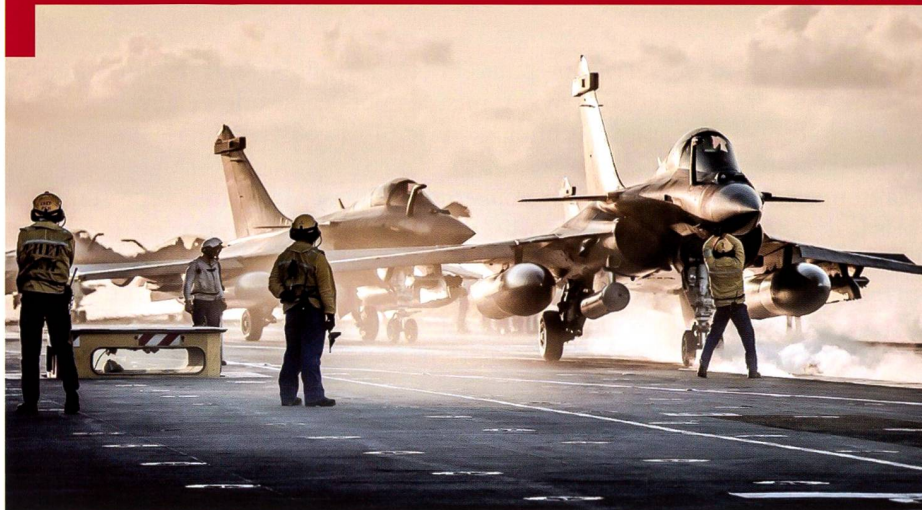
Rafale de version navale en opération sur le porte-avion Charles de Gaulle.