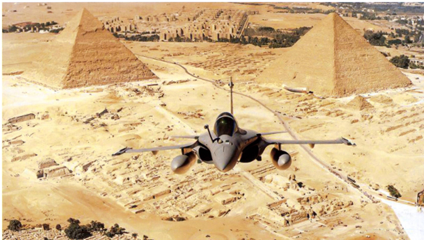
L'Egypte, premier client international à acheter le Rafale à l'export, où comment contempler 4'000 ans d'histoire depuis la 3 e dimension.

car Brasilia décida de l'acquisition de 36 appareils suédois Gripen . Comme pour le marché suisse, en 2014, le volet économique semble avoir poussé les Brésiliens vers un appareil moins dispendieux, partenariat doublé, de plus, d'échanges technologiques relativement avancés. La France n'était également pas parvenue à placer son Rafale au Maroc qui, en 2007, avait choisi le F-16C/D, appareil qui commence d'ailleurs à devenir à la mode dans les cieux des pays est-européens et qui s'équipent majoritairement auprès de l'Oncle Sam. L'Arabie Saoudite, Singapour, la Pologne, la Corée du Sud appartiennent également aux pays qui n'ont pas retenus une offre de l'avionneur français.