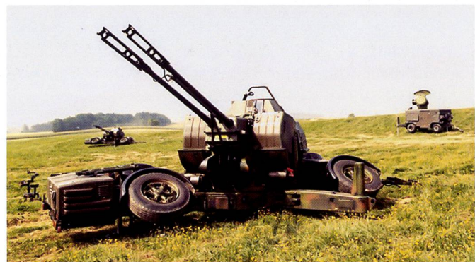
Ci-dessus : Le canon de DCA 63/90 et le système Skyguard n'a pas été délégué aux Grandes Unités des Forces terrestres. Il est destiné à protéger des objets de haute valeur et des infrastructures critiques. Ci-dessous : Le radar ALERT permet d'augmenter sensiblement l'efficacité et la durabilité des formations Stinger .