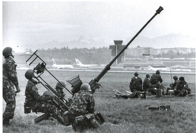
Mise en batterie d'une unité de feu 20 mm (can DCA L 54) sur l'aéroport international de Genève-Cointrin.

Les trois systèmes de défense aérienne actuels – Stinger , Skyguard/35mm et Rapier – sont maintenant âgés et devront être remplacés à partir de 2022. Les canons de 35mm et les Skyguard ont récemment été modernisés pour leur permettre de rester efficaces jusqu'en 2025-2030, alors que la mise hors service du Rapier est demandée par le Conseil fédéral avec le message aux chambres fédérales 2020. Ils représentent les moyens de la défense aérienne de l'espace aérien inférieur (en dessous de 3'000m sol) et ne sont efficaces que contre des appareils volant à basse ou à très basse altitude. Leur portée est limitée à moins de 10 km. La composante sol-air (allemand : BOUDLUV) du programme Air 2030 doit permettre de remplacer partiellement ces systèmes et de réintroduire des missiles de défense sol-air à longue portée.