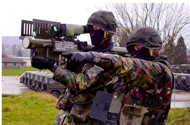
Cours de répétition du groupe engins guidés légers DCA 1 au sein de la brigade blindée 1. Engagement des unités de feu Stinger .