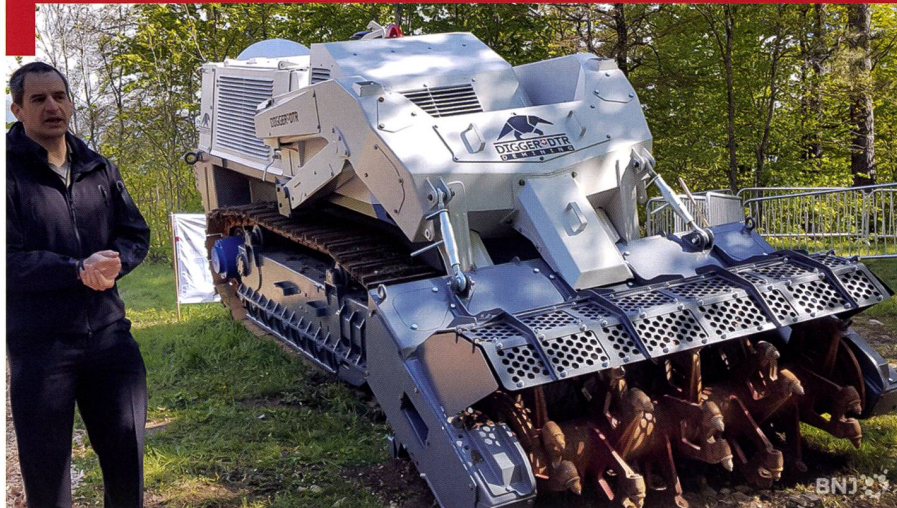
Présentation des nouveaux modèles à Tavannes.