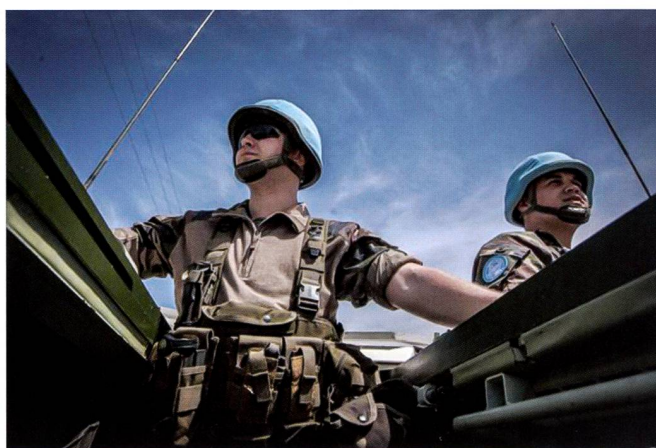
La protection de convois est une mission essentielle. Elle peut être sensiblement améliorée par l'emploi de drones.

Si les nouvelles technologies sont une aubaine pour la paix, elles ne sont pas dépourvues de controverses et d'hostilité. Elles présentent également de nouveaux défis, voire de nouvelles menaces. La disponibilité accrue de drones commerciaux implique que la même technologie pourrait également atterrir entre les mains d'adversaires mal intentionnés, qui pourraient également utiliser ces technologies pour surveiller les mouvements des soldats de la Paix. Des groupes terroristes ont également utilisé des téléphones portables pour faire exploser à distance des engins explosifs. Deux drones à courte portée déployés dans l'est de l'Ukraine par l'OSCE ont été victimes de brouillages de niveau militaire et on a tenté à plusieurs reprises de les abattre. 29