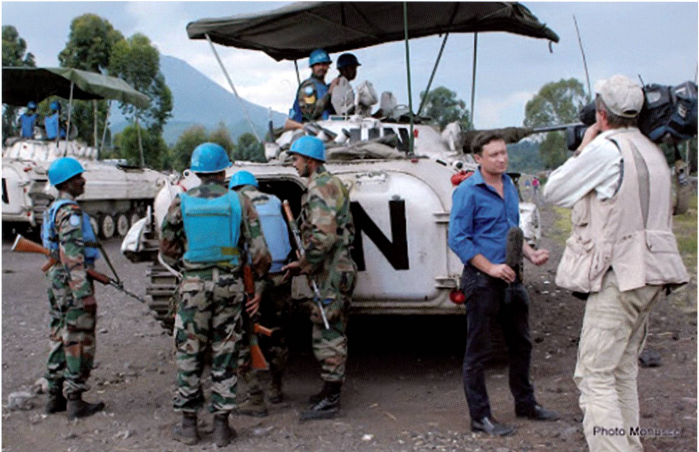
Une équipe de journalistes devant une patrouille de casques bleus. L'Inde a engagé des véhicules de combat d'infanterie (VCI) BMP-2 en RDC au sein de la MONUSCO.

Un an plus tard, en 2013, l'ONU a lancé des véhicules aériens sans pilote dans sa mission en RDC (MONUSCO) et le système a contribué à localiser les camps rebelles, à identifier les mines illégales, à déterminer la présence d'armes, à offrir une connaissance de la situation en temps réel et à sauver plusieurs civils lors d'une noyade dans le lac Kivu en 2014.