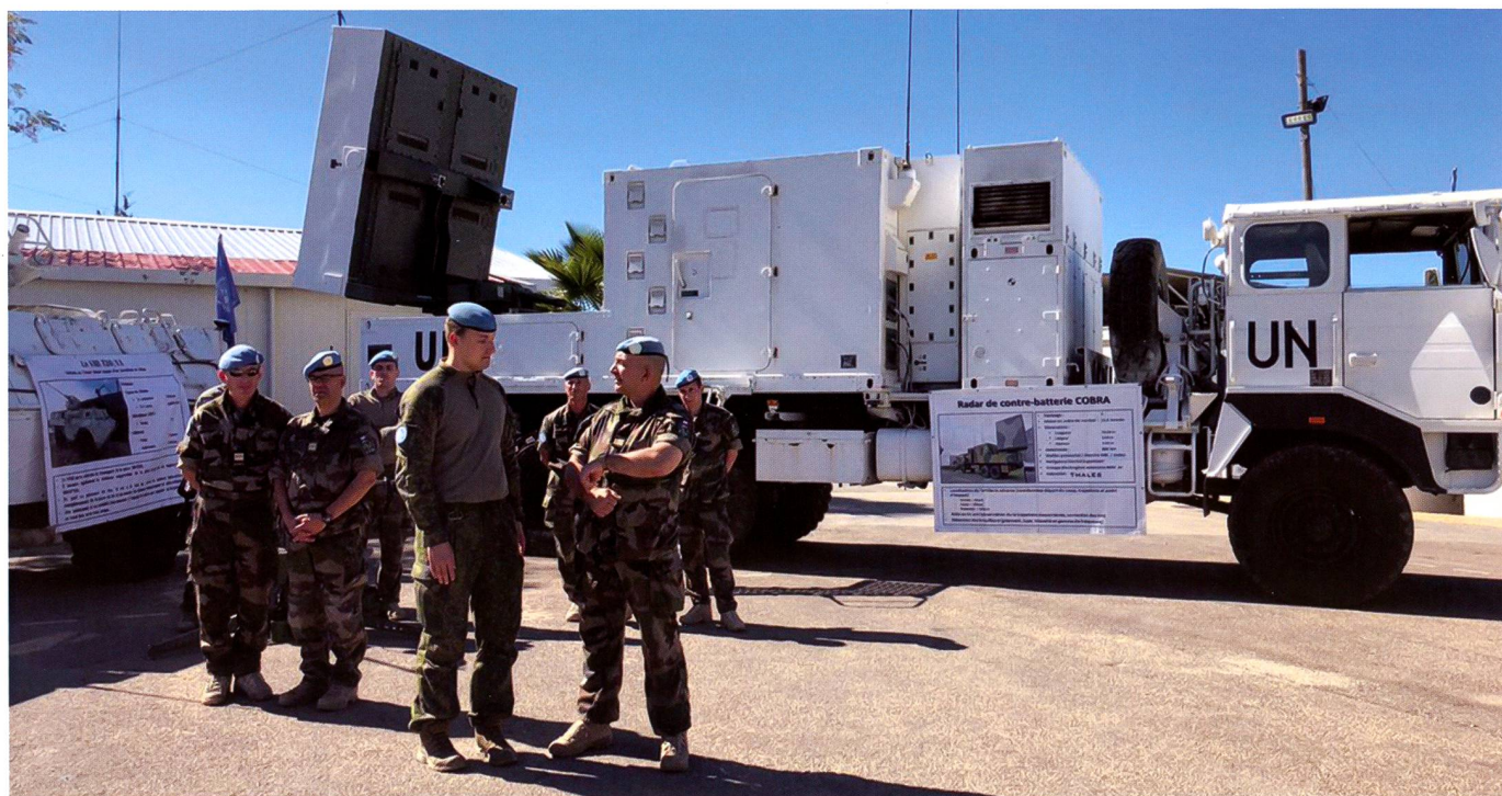
Casques bleus français devant un radar d'artillerie COBRA. Le système a été développé par Thales et est en service en France, en Allemagne ainsi qu'au Royaume-Uni.

formes d'équipements de vision nocturne, on trouve « des casques (lunettes), des lunettes monoculaires, des jumelles ou des viseurs d'armes - généralement des systèmes d'intensification d'image avec une certaine capacité proche infrarouge » ainsi que des systèmes d'imagerie thermique. 17