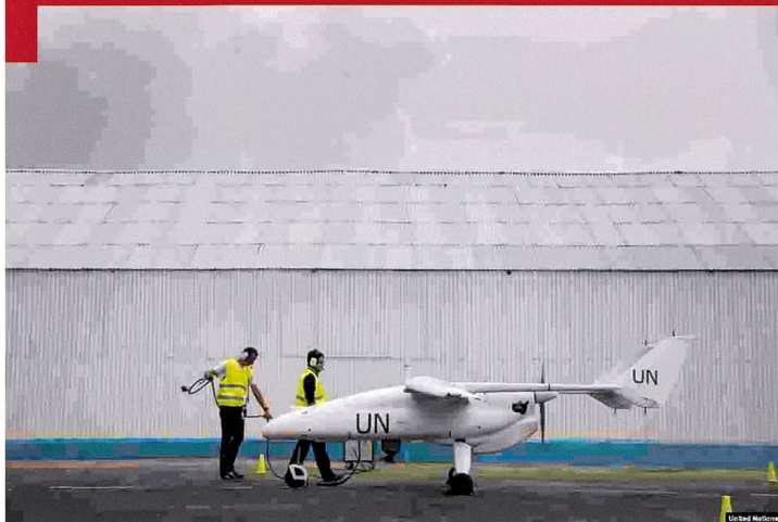
Toutes les photos © ONU via l'auteur, sauf mention particulière.